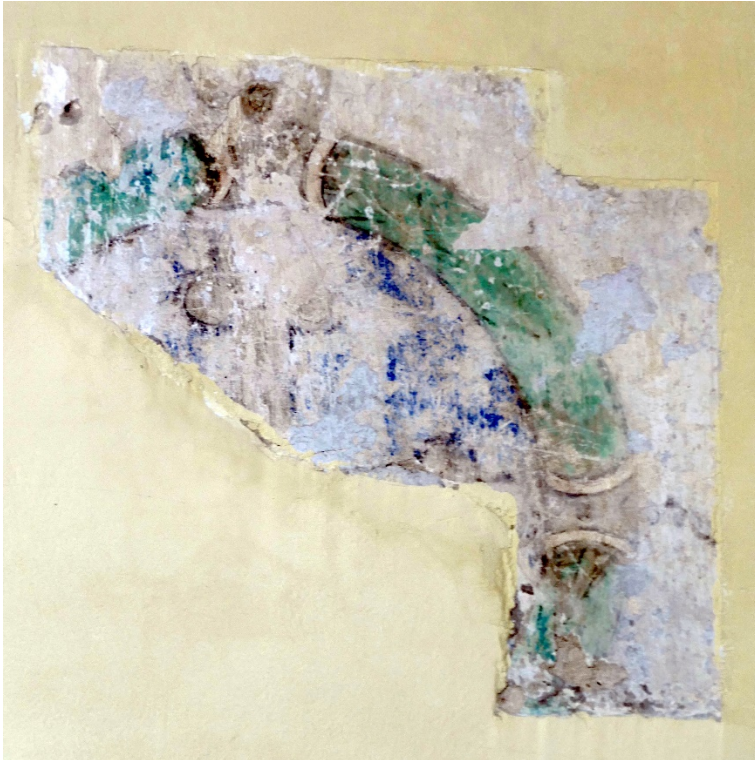
Wyszogród, kościół franciszkanów konwentualnych pw. Matki Bożej Anielskiej i św.św. Franciszka i Antoniego, prezbiterium, pierwsze przęsło, ściana północna, narożnik wschodni, odkrywka z fragmentem zacheuszka, ok. 1675, wyk. niezidentyfikowany warsztat lokalny, 2019