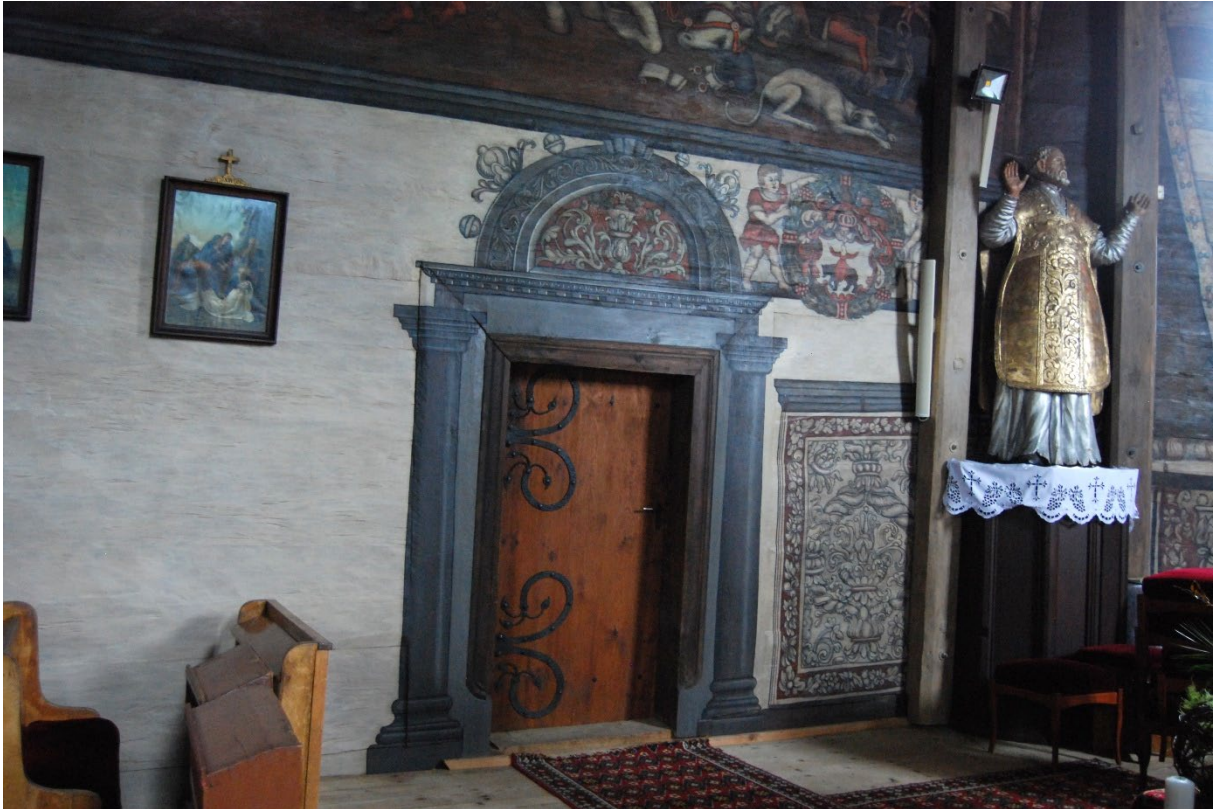
Boguszyce, kościół par., nawa południowa, portal wejściowy z iluzjonistyczną dekoracją architektoniczną i inskrypcją fundacyjną, fot. MW, 2016.