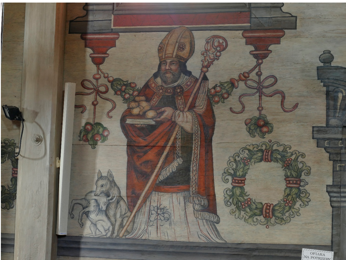
Boguszyce, kościół par., zamknięcie prezbiterium, postać św. Stanisława, fot. MW, 2016.