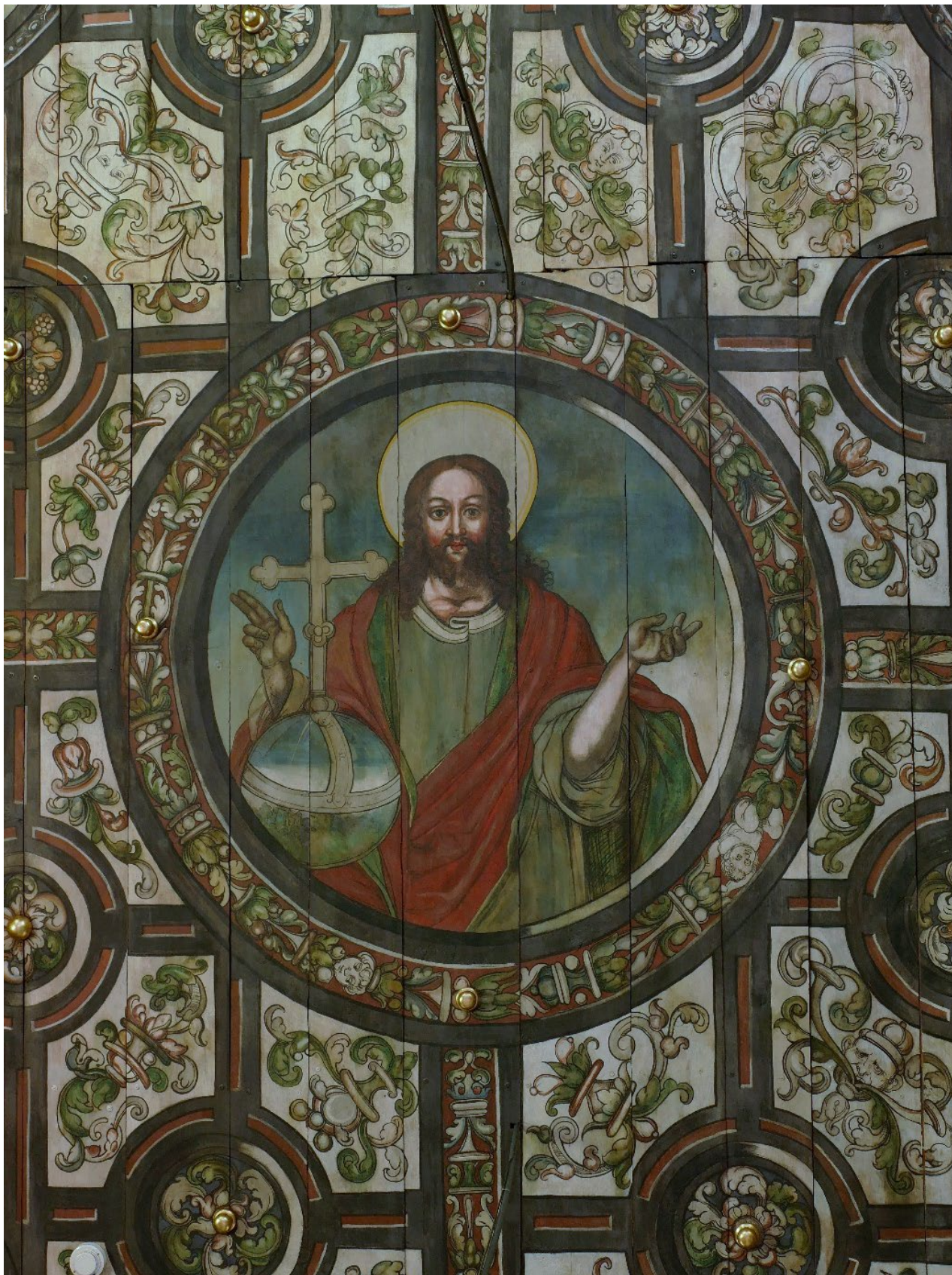
Boguszyce, kościół par., prezbiterium, strop płaski, dekoracja kasetonowa w centralnym polu z postacią Jezusa Chrystusa Pantokratora, fot. MW, 2016.