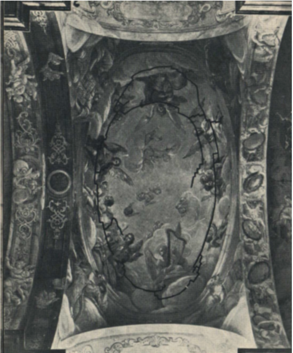
Il. 6. Kobyłka, polichromia na sklepieniu z udokumentowaniem spękań sklepienia, wg: „Biuletyn Konserwatorski Województwa Warszawskiego”, Warszawa 1958, il. 22.