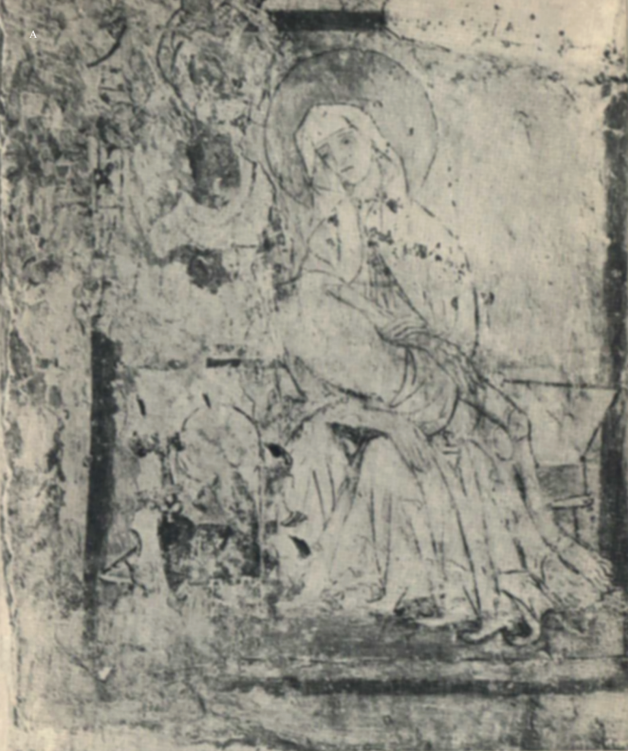
▲ Il. 1. ► Il. 2. Czerwińsk, kościół Kanoników Regularnych, kaplica południowa, polichromia romańska. A – stan w 1958 r. Wg: „Biuletyn Konserwatorski Województwa Warszawskiego”, Warszawa 1958, il. 29; B – stan w 2016 r.; fot. Małgorzata Korpała.