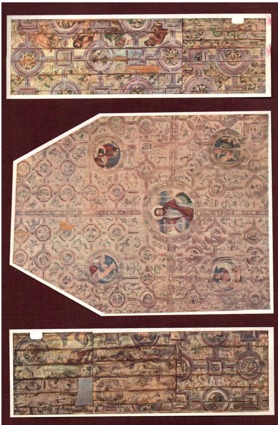
Il. 9. Boguszyce, polichromia na stropie prezbiterium oraz fragmenty ze stropu nawy północnej i południowej – stan w latach 30. XX w., wg: Studia do dziejów sztuki w Polsce , t. 2, Warszawa 1930, barwna wkładka z inwentaryzacją malarską wykonaną pod kier. Stefana Daukszy.