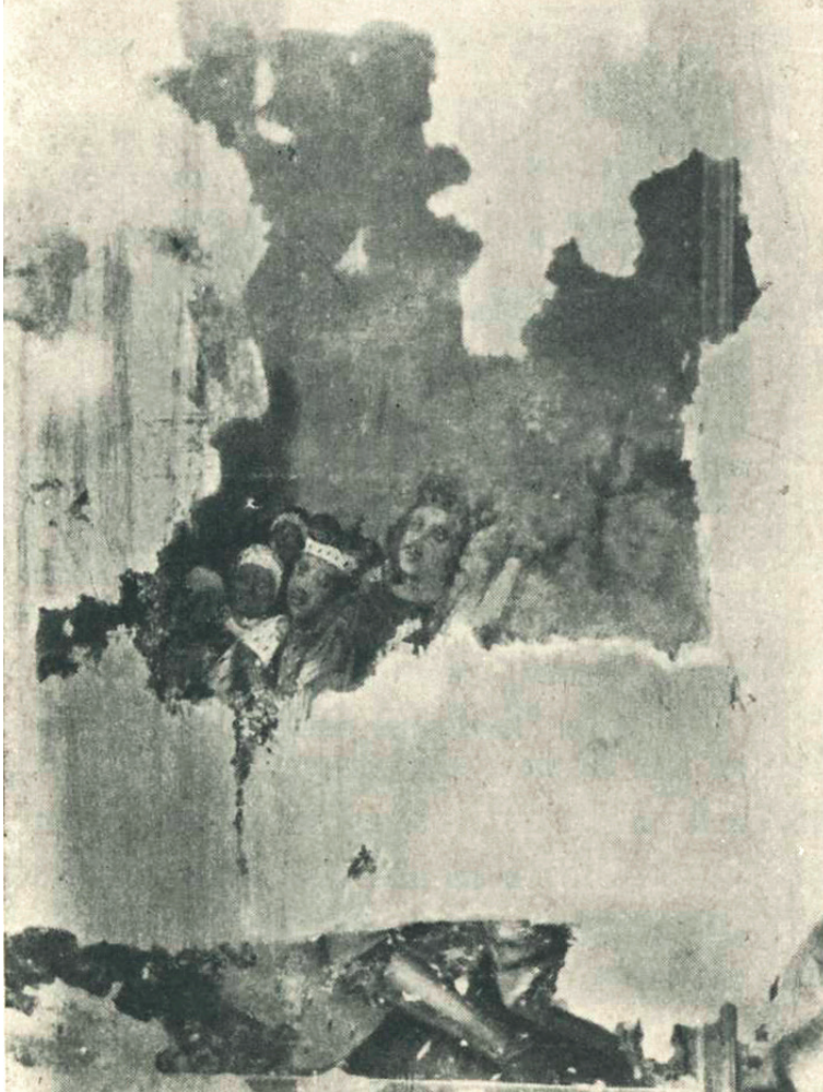
Il. 5. Łowicz, kościół popijarski – odkrywki polichromii w latach 20. XX w., wg: „Ochrona Zabytków Sztuki”, 1930, cz. 1., s. 220, il. 30.

Od szeregu lat zauważano, że konieczne jest aktualizowanie wcześniejszych katalogów 12 .