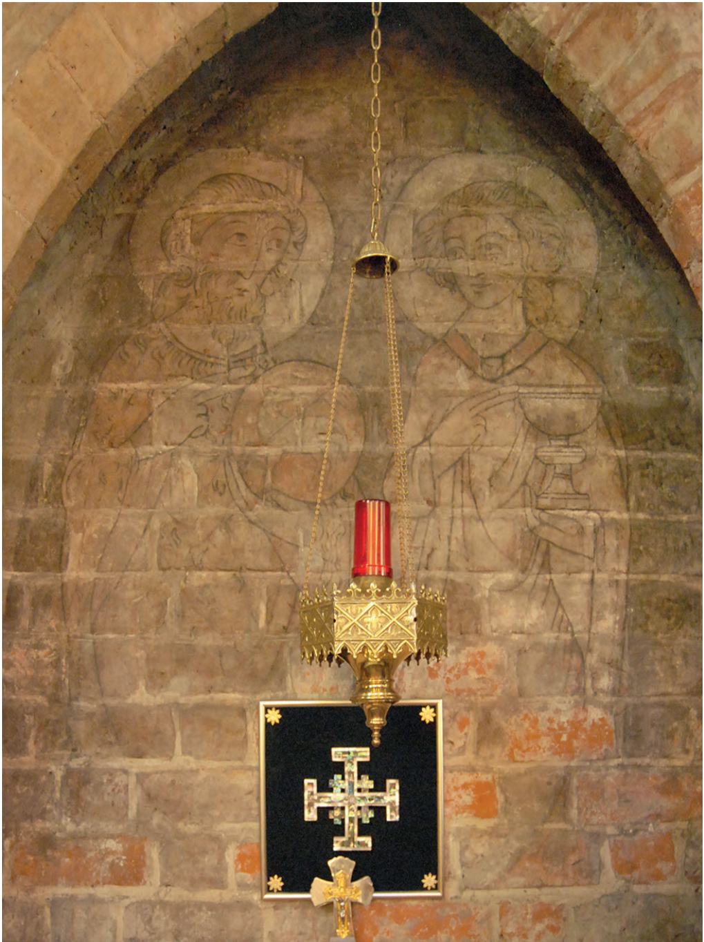
◀ Il. 3. ▲ Il. 4. Gniezno, kościół p.w. św. Jana, fragment gotyckiej polichromii w prezbiterium: A – stan w latach 20. XX w., malarska dokumentacja polichromii, wg: „Ochrona Zabytków Sztuki” cz. 1, s. 191, il. 189; B – stan w 2013 r.; fot. Małgorzata Korpała.