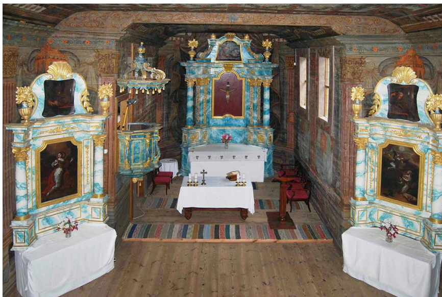
Ryc. 6. Kościół z Wolanowa (obecnie Muzeum Wsi Radomskiej), widok wnętrza w kierunku prezbiterium, fot. 2016.