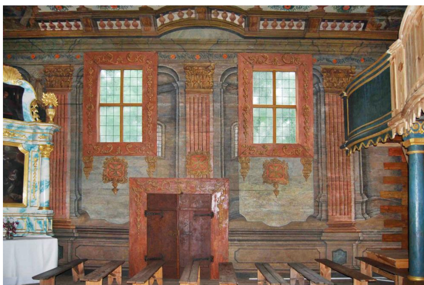
Ryc. 7. Kościół z Wolanowa (obecnie Muzeum Wsi Radomskiej), południowa ściana nawy, fot. 2016.