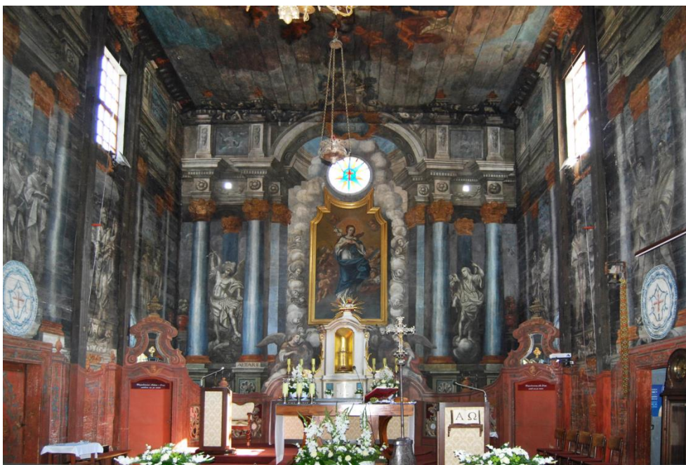
Ryc. 8. Porzecze Mariąskie, fragment iluzjonistycznej architektury ołtarza, fot. 2016.