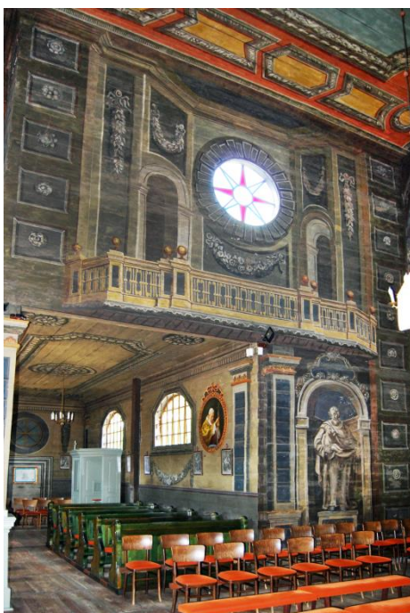
Ryc. 9. Porzecze Mariąskie, widok na ścianę południową, fot. 2016.