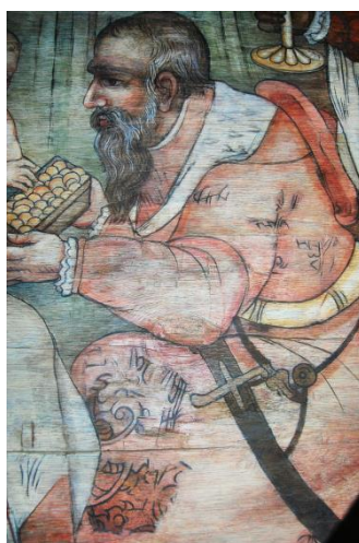
Ryc. 3. Boguszyce, fragment Pokłonu Trzech Królów, stan po konserwacji, fot. 2016.

Fig. 2. Boguszyce, view of the southern wall of the nave, fot. in 2016.