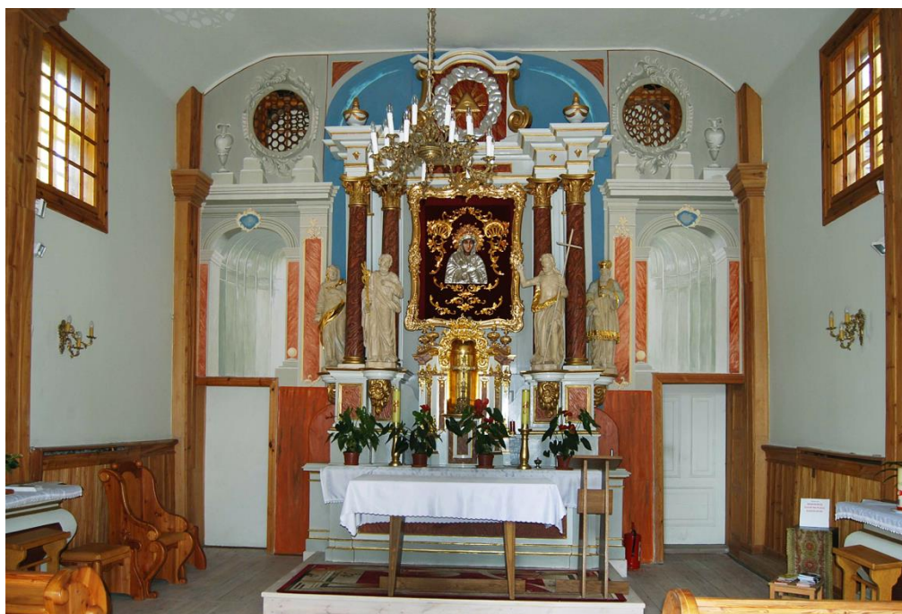
Ryc. 10. Puszcza Mariańska, współczesna polichromia odtworzona po pożarze kościoła, fot. 2016.