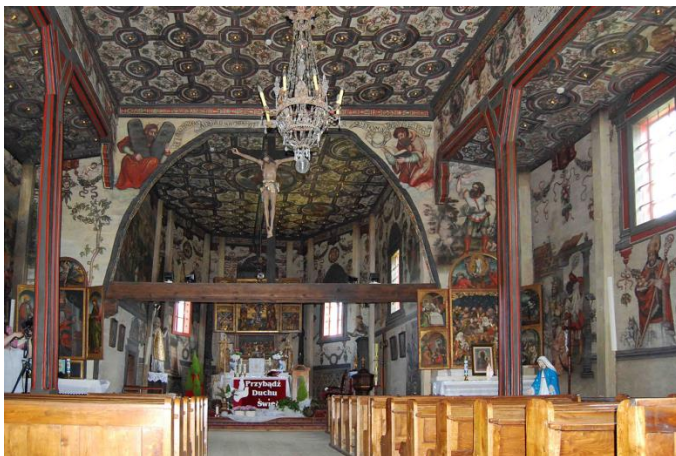
Ryc. 1. Boguszyce, widok wnętrza w kierunku prezbiterium, fot. 2016.

Fig. 1. Boguszyce, interior view towards presbytery, fot. in 2016.