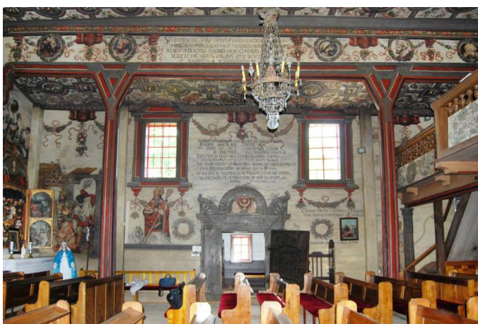
Ryc. 2. Boguszyce, widok południowej ściany nawy, fot. 2016.

Fig. 1. Boguszyce, interior view towards presbytery, fot. in 2016.