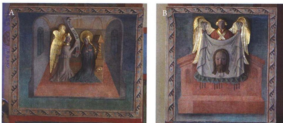
Ryc. 4. Katedra pw. św. św. Wacława i Stanisława w Świdnicy (woj. dolnośląskie), polichromowane kapitele w kaplicy chóru mieszczańskiego, po konserwacji: A — scena Zwiastowania, B — przedstawienie Veraiikon . Fot. M. Korpała, 2010