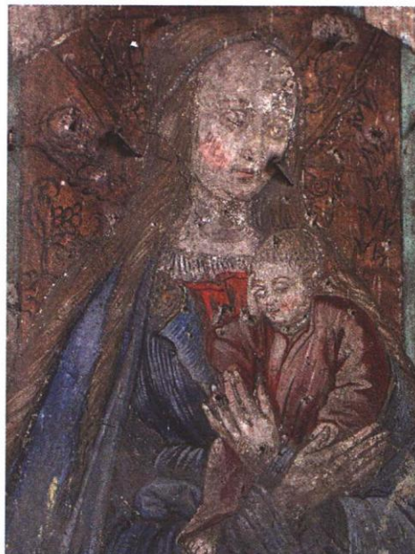
Ryc. 6. Kościół św. Jerzego w Dzierżoniowie (woj. dolnośląskie), malowidło Madonna z Dzieciątkiem — stan przed konserwacją.