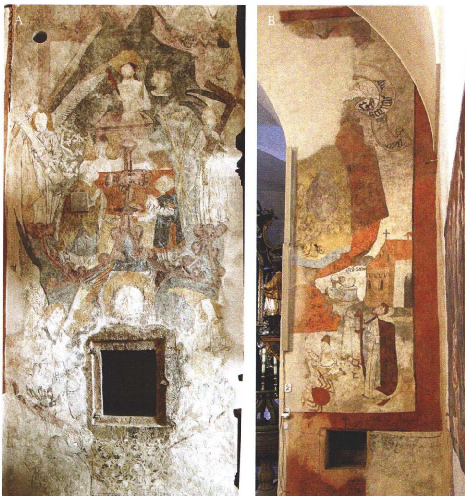
Ryc. 7. Kościół w Hajdukach Nyskich (woj. opolskie), malowidła na ścianie tęczowej, po konserwacji: A — Msza św. Grzegorza Wielkiego, B — św. Krzysztof. Fot. R. Szelwach, 2013

przedstawienia figuralne datowane na około 1480–1500 rok. Od strony północnej namalowano anioły adorujące oblicze Chrystusa na tle białej tkaniny ( Veraikon ) z iluzyjną architekturą w tle. Powyżej znajduje się druga część malowidła, które przedstawia Mszę św. Grzegorza Wielkiego (ryc. 7A). Od strony południowej znajduje się odsłonięta w 2012 roku kompozycja z około 1500 roku przedstawiająca św. Krzysztofa (ryc. 7B).