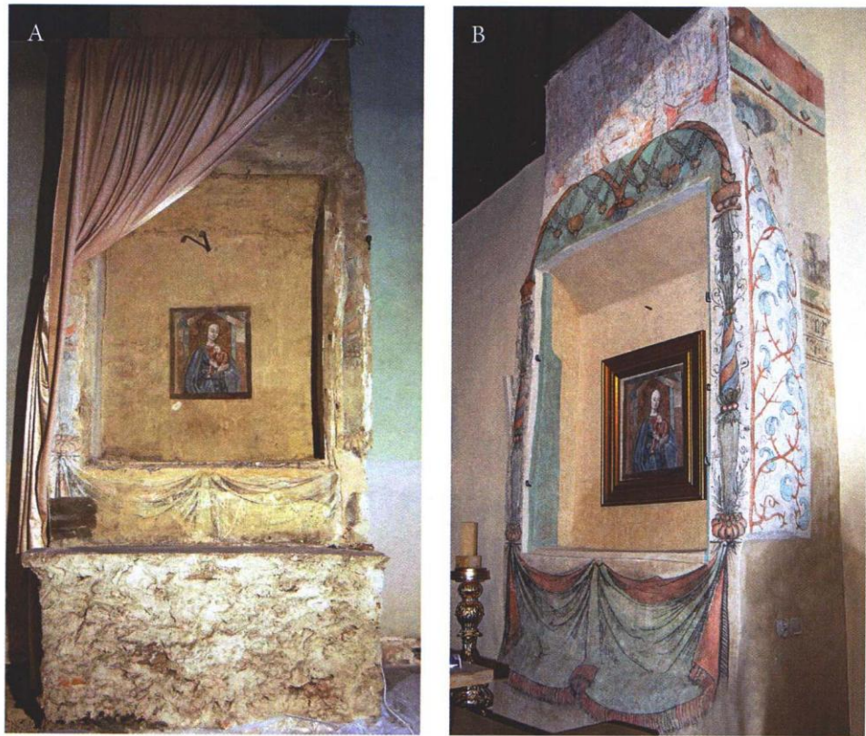
Ryc. 5. Kościół św. Jerzego w Dzierżoniowie (woj. dolnośląskie), filar z odkrytym w niszy malowidłem Madonna z Dzieciątkiem: A — stan przed konserwacją, B — stan po konserwacji.