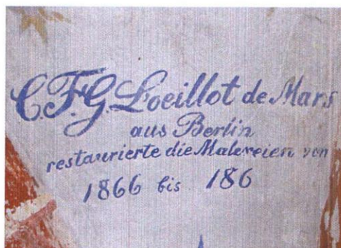
Ryc. 2. Kościół w Małujowicach koło Brzegu (woj. opolskie), sygnatura konserwatora malowideł C. L'Oeillot de Marsa z datą przeprowadzenia prac konserwatorskich (lata 1866–186[9]). Fot. M. Korpała, 2009

KOWSKI, KACZMAREK 2009). Zachowane tam figuralne polichromie ściennie stanowią ewenement na skalę całego kraju jako jeden z najbogatszych cykli gotyckich malowideł ściennych, pomyślany jako Biblia pauperum (ryc. 1). Wraz z kilkunastoma innymi tworzą one grupę unikalnych średniowiecznych malowideł nazywanych Szlakiem Polichromii Brzeskich . Dekoracje zostały zamalowane w latach 30. XVI wieku i odsłonięte dopiero w drugiej połowie XIX wieku. Na sklepieniu przy ścianie północnej znajduje się sygnatura konserwatora malowideł C. L'Oeillot de Marsa z datą przeprowadzenia prac konserwatorskich (lata 1866–186[9]; ryc. 2). Cennym źródłem wiedzy o XIX-wiecznych pracach jest także zachowana dokumentacja prac przeprowadzonych przez tego konserwatora z 1871 roku, która zawiera fotografie. Zakres ingerencji konserwatorskiej był bardzo duży, gdyż po odsłonięciu malowidła zostały poddane estetyzacji sprowadzającej się do ich gruntownego przemalowania.