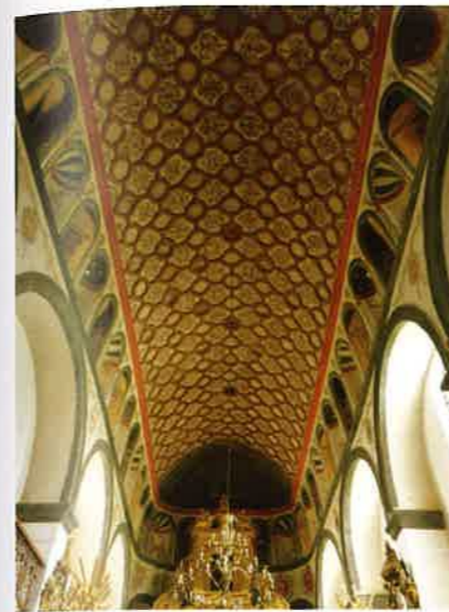
Pultusk, kolegiata, widok ogólny w kierunku prezbiterium, zespół polichromii renesansowych, technika mieszana al fresco-al secco , 1551–1560, proj. Giovanni Battista Venetus z Plocka, wyk. Wojciech z Warszawy z udziałem Stanisława z Łomży i Stanisława z Liwu, fot. MW, 2010

żone floratury. Czasem wypełniły ułożone naprzemiennie pasy gwiazd i winorośli.