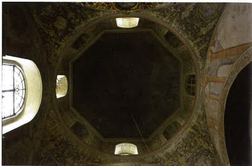
Pultusk, kolegiata, kaplica grobowa biskupa Jędrzeja Noskowskiego, polichromia kopuły, technika mieszana al fresco-al secco , lata 50. XVI w., proj. Giovanni Battista Venetus z Plocka, wyk. Stanisław Pieczonka z Nowej Warszawy (atryb.), fot. MW, 2016