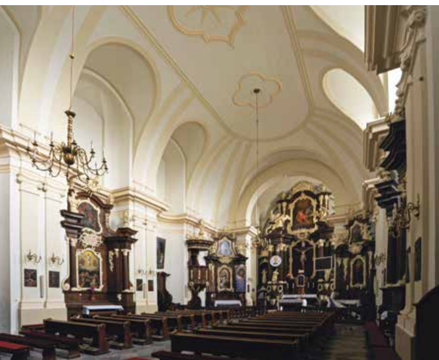
Płock, kościół franciszkanów reformatów, widok ogólny wnętrza z wystrojem ołtarzowym, l. 60.-70. XVIII w., proj. arch. Benjamin Kaal z Brodnicy, wyk. nieznaną warsztat rzeźbiarski z Prus Królewskich

natomiast w skromnym wyposażeniu ołtarzowym widać dalekie echa stołecznego kościoła bernardyńskiego św. Anny przy Krakowskim Przedmieściu. Artystyczną oprawę wnętrza stanowią freski pędzla Kazimierza Ślizawskiego z 1792 r., które reprezentują schyłkową fazę późnego baroku i rokoka, wspartego w kreacji iluzjonistycznych nastaw bocznych i scen figuralnych graficznymi inspiracjami z Augsburga i Europy Środkowej.