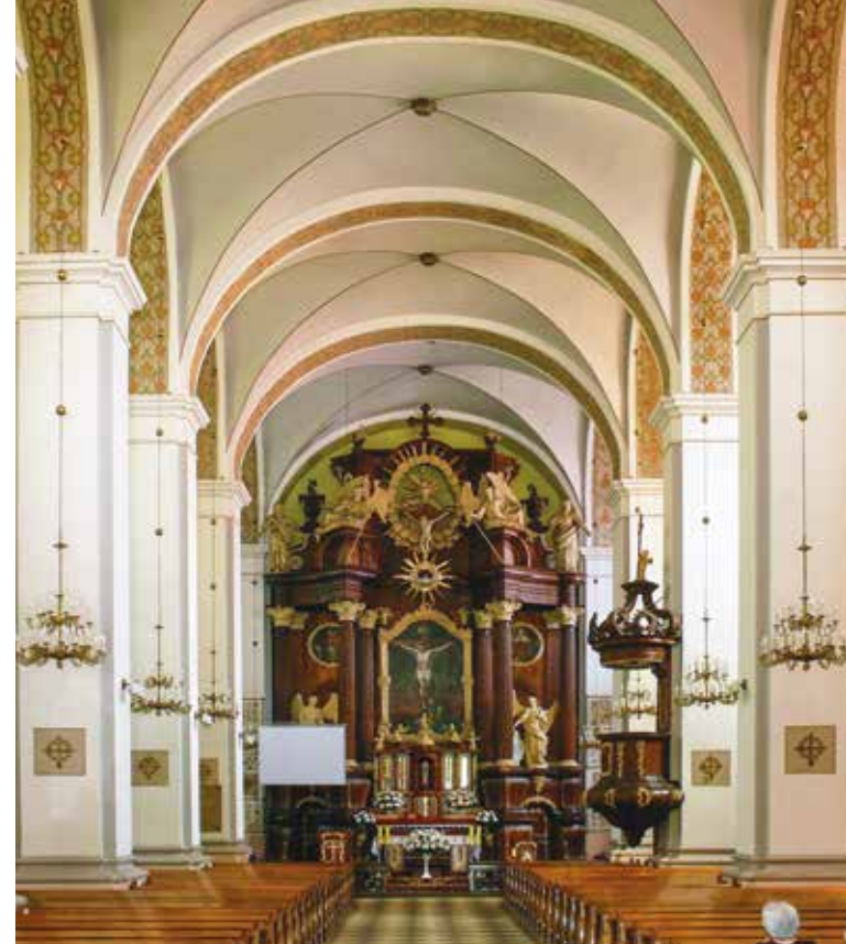
Żuromin, kościół jezuitów / franciszkanów reformatów, widok ogólny wnętrza z wystrojem ołtarzowym, l. 70. XVIII w., wyk. nieustalona pracownia z Wielkopolski lub Prus Królewskich

Przemierzając się dalej na południowy zachód ku Wiśle, przez tereny dawnej ziemi zakroczymskiej, warto zawitać do Wyszogrodu , w XI-XIV w. pełniącego ważną rolę grodu mazowieckiego i siedziby książęcej, a dzisiaj słynącego z pięknych panoram wiślanych i dedykowanego rzece muzeum . Tutejszy kościół parafialny Piastowie przekazali w 1320 r. Zakonowi Rycerskiemu Grobu Bożego w Jerozolimie (zwanemu na ziemiach polskich bożogrobcami lub