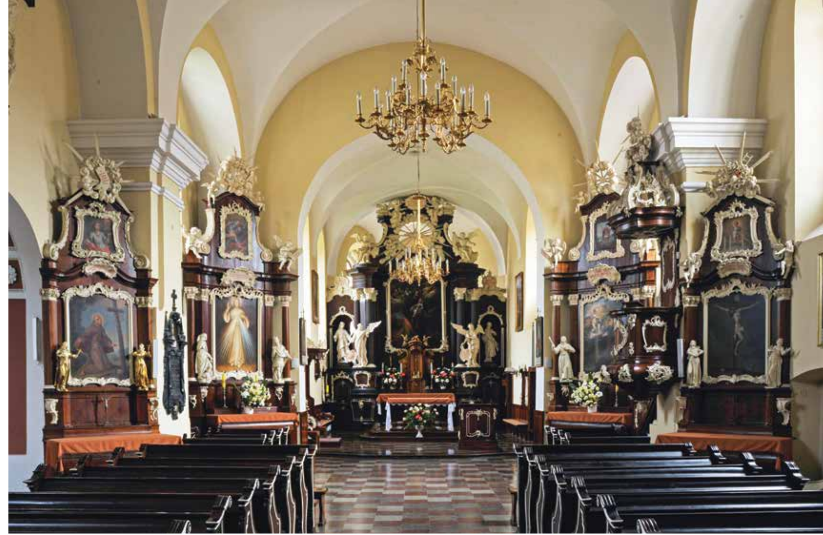
▲ Pułtusk – Stare Miasto, kościół franciszkanów reformatów, widok ogólny wnętrza z wystrojem ołtarzowym, l. 70. XVIII w., wyk. nieustalona pracownia z Wielkopolski lub Prus Królewskich

Mazowsze zwane Starym lub Polnym, obejmujące obszary dawnych przedpiastowskich opoli z X w. wokół Płocka, po linii rzek Wkry (Działdówki) na północy i Narwi na wchodzie, jest terenem zazwyczaj pomijanym w badaniach nad sztuką XVII i XVIII w. Z wyjątkiem królewskiego (i wojewódzkiego) Płocka, biskupiego Pułtusza oraz będącego siedzibą i miejscem mauzoleum rodzowego Krasieńskich Krasnego pod Przasnyszem zabytki z tych stuleci na omawianym terenie doczekały się tylko ogólnego omówienia w studiach regionalnych.