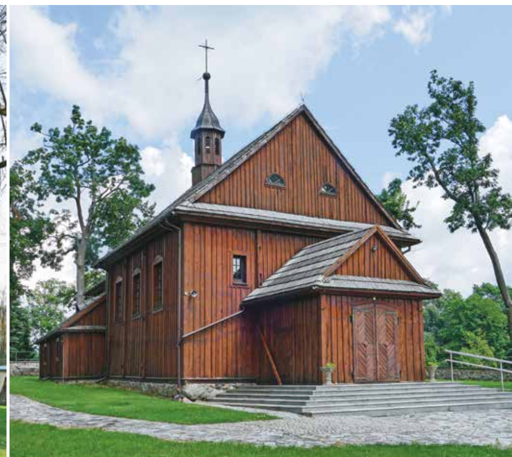
Zwola Poduchowna, kościół parafialny, przed 1687 r.

habsburskich, który wcześniej pracował m.in. w kościele bernardynów św. Anny przy Krakowskim Przedmieściu.