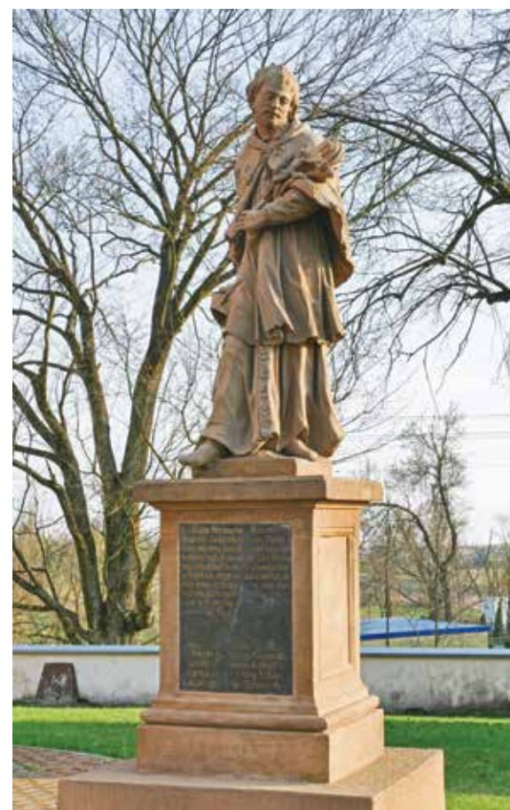
Kuflew, figura św. Jana Nepomucena, 1777 r., wyk. nieustalony italianizujący rzeźbiarz środkowoeuropejski z Warszawy