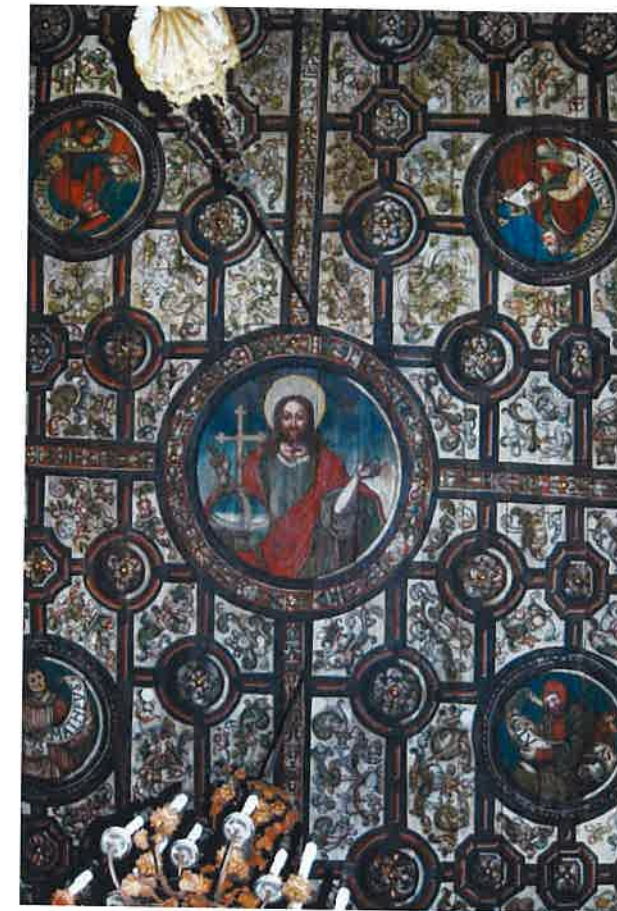
Ryc. 3b. Boguszyce, pow. Rawa Mazowiecka, kościół, dekoracja stropu nawy.