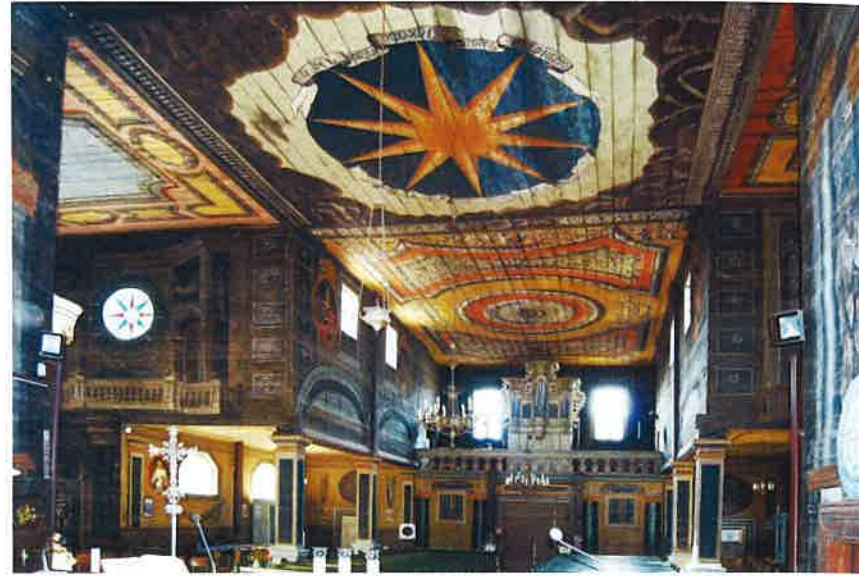
Ryc. 5a. Porzecze Mariańskie, pow. garwoliński, kościół, widok ogólny nawy i transeptu. Fig. 5. Porzecze Mariańskie, Garwolin dis., the church, overall view of the nave and transept.