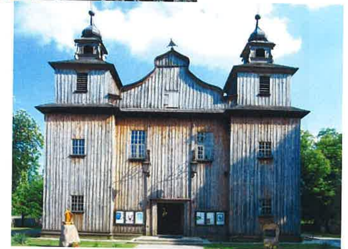
Ryc. 4. Porzecze Mariąskie, pow. garwoliński, bryła kościoła.