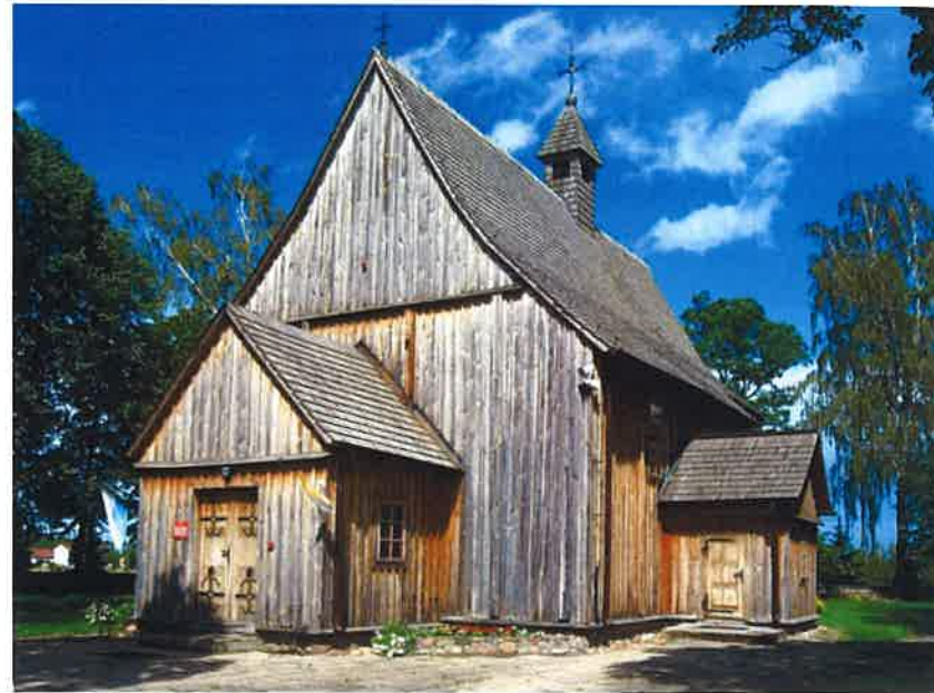
Ryc. 2. Boguszyce, pow. Rawa Mazowiecka, bryła kościoła. Fig. 2. Boguszyce, Rawa Mazowiecka dis., bulk of the church.