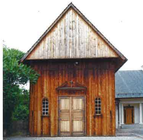
8. Puszcza Mariańska, pow. żyrardowski, bryła kościoła. Fot. J. Lewicki 2016. Puszcza Mariańska, Żyrardow dis., bulk of the church. Photo: J. Lewicki 2016.