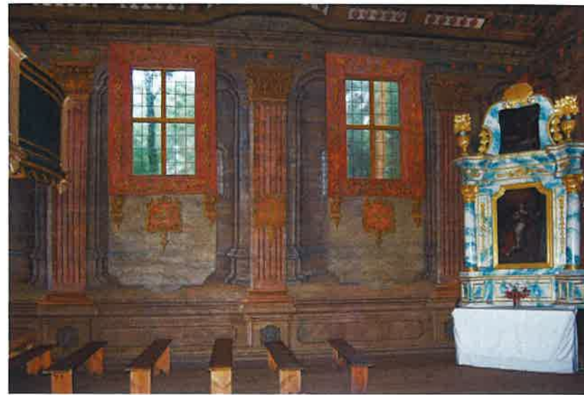
Ryc. 7b. Kościół z Wolanowa, obecnie Muzeum Wsi Radomskiej, widok na ścianę północną. Fig. 7b. Church in Wolanow, currently Museum of the Radom Region Village; view onto the north wall.