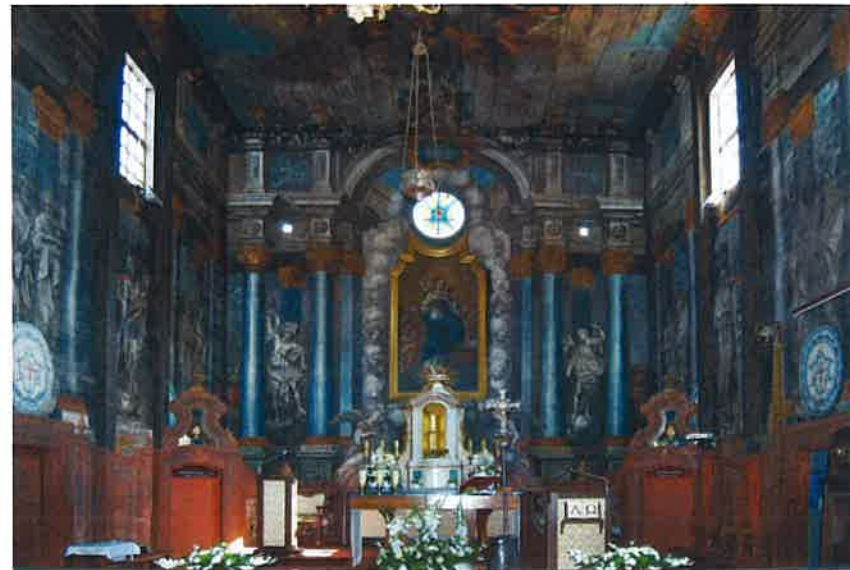
Ryc. 5b. Porzecze Mariańskie, pow. garwoliński, kościół, widok w kierunku wschodnim na ołtarz główny. Fig. 5a. Porzecze Mariańskie, Garwolin dis., view eastwards onto the main altar (B.).