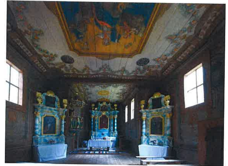
Ryc. 7a. Kościół z Wolanowa, obecnie Muzeum Wsi Radomskiej, widok ogólny w kierunku wschodnim. Fig. 7a. Church in Wolanow, currently Museum of the Radom Region Village; overall view towards the east.