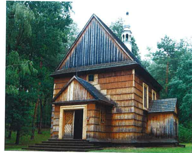
Ryc. 6. Kościół z Wolanowa, obecnie Muzeum Wsi Radomskiej, bryła. Fig. 6. Church in Wolanow, currently Museum of the Radom Region Village, bulk.