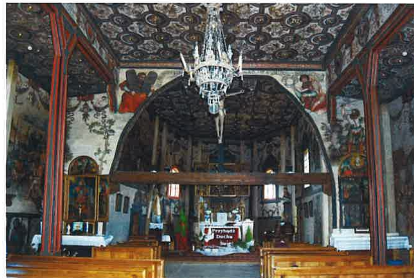
Ryc. 3a. Boguszyce, pow. Rawa Mazowiecka, kościół, widok ogólny w kierunku wschodnim. Fig. 3a. Boguszyce, Rawa Mazowiecka dis., the church, a general view towards the east.