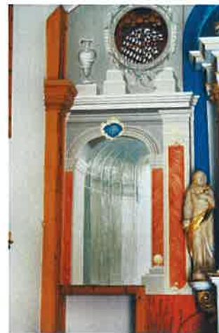
Ryc. 9. Puszcza Mariańska, pow. żyrardowski, kościół, fragment dekoracji ołtarza na ścianie wschodniej. Fig. 9. Puszcza Mariańska, Żyrardow dis., the church, fragment of the decoration of the altar on the eastern wall.