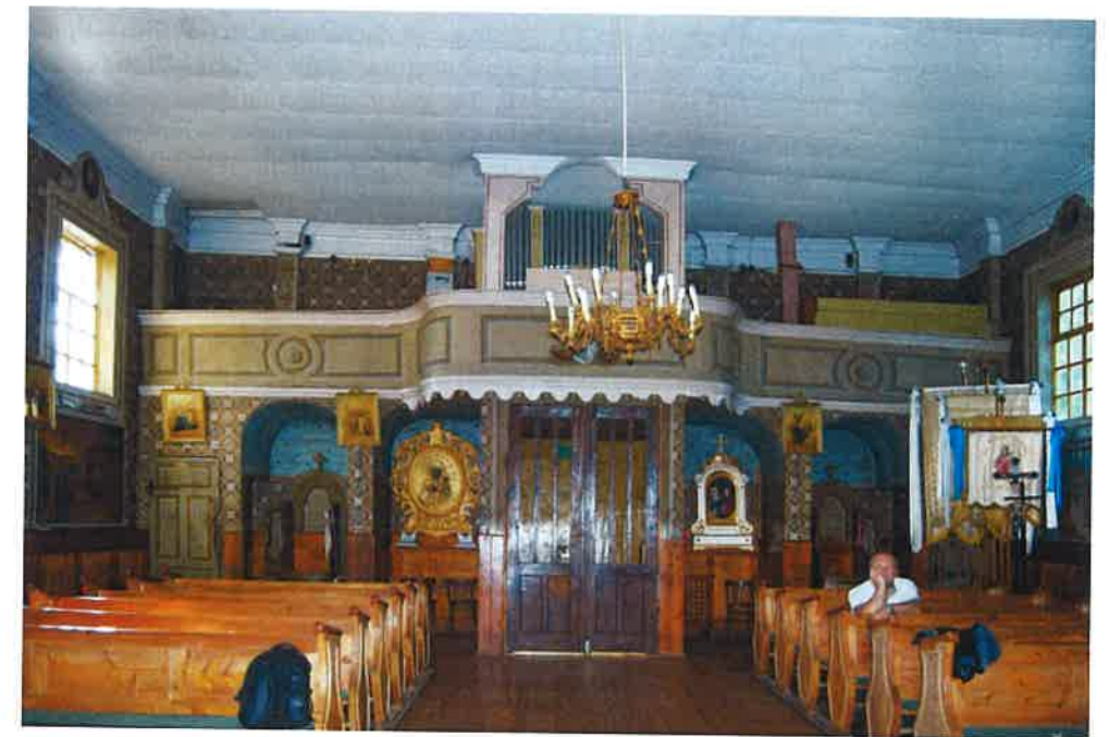
Fig. 11. Skuły, Żyrardow dis., the church, view towards the west onto the choir.