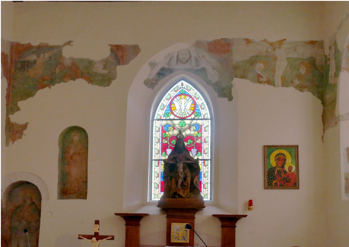
Sierpc, kościół szpitalny pw. Św. Ducha, polichromia wnętrza, 1519-1529, wyk. niezidentyfikowany warsztat z Prus Królewskich (?), widok ogólny prezbiterium