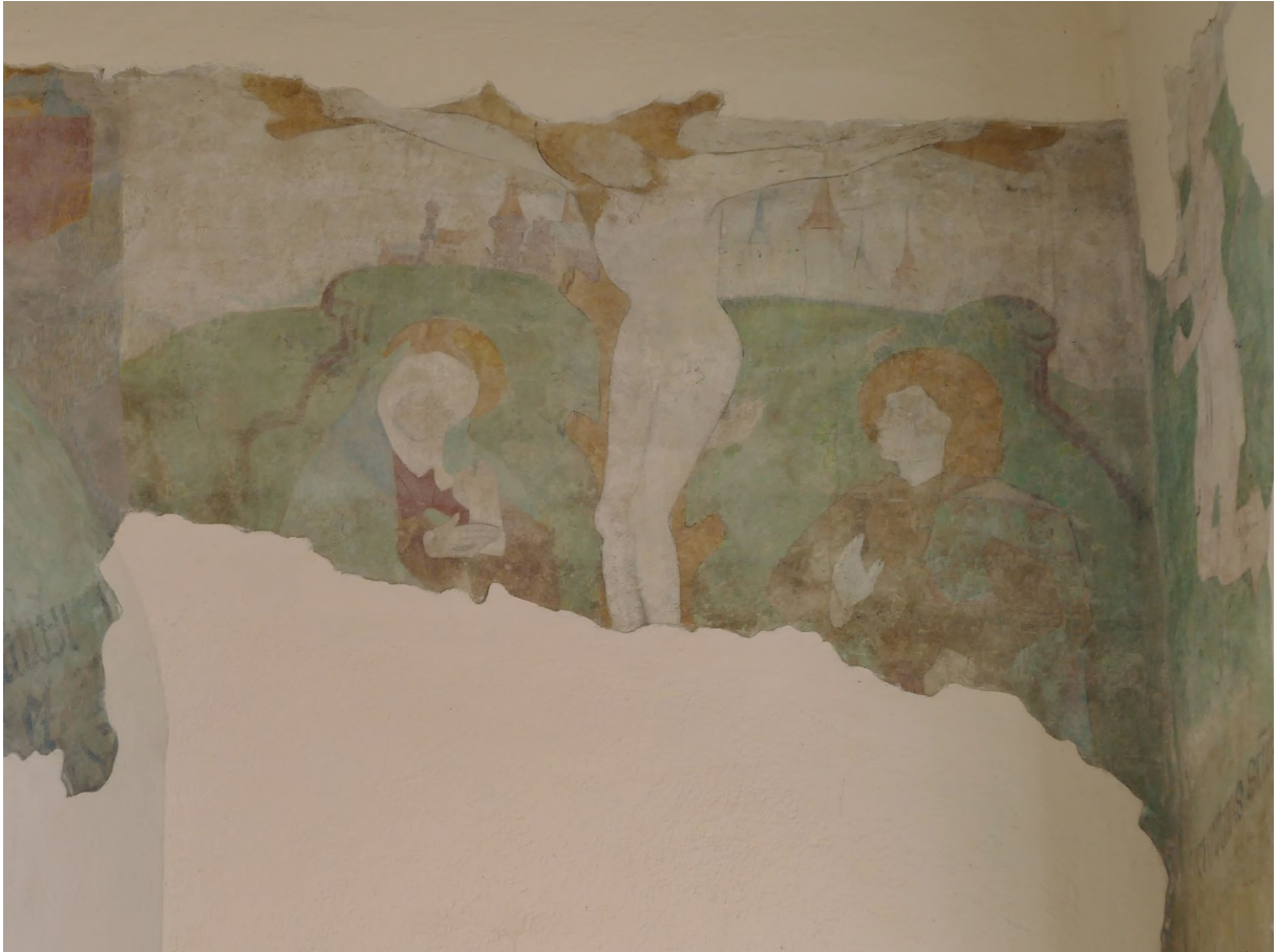
Sierpc, kościół szpitalny, prezbiterium, ściana wschodnia, polichromia, scena Ukrzyżowanie , fot. MW, 2016.