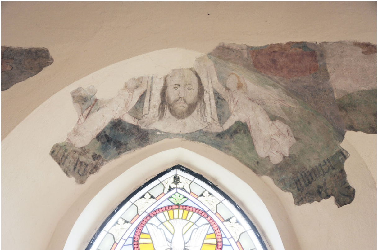
Sierpc, kościół szpitalny, prezbiterium, glif okna,, polichromia, scena Veraicon , fot. MW, 2016. Sierpc, kościół szpitalny, prezbiterium, ściana południowa, ściana północna, polichromia,