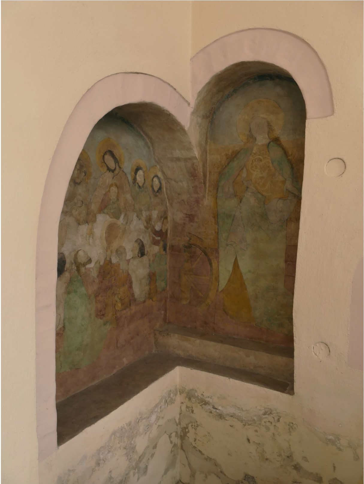
Sierpc, kościół szpitalny, prezbiterium, narożnik północno-wschodni, dwudzielna nisza, polichromia, scena Ostatnia Wieczerza i św. Katarzyna Aleksandryjska, fot. MW, 2016.