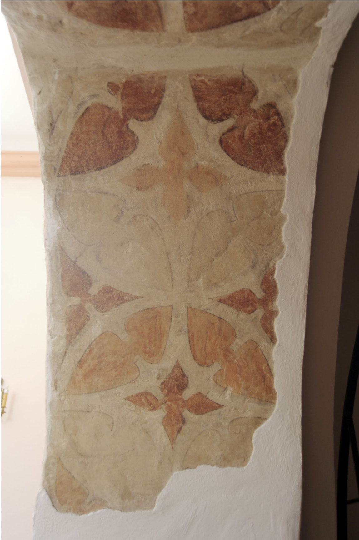
Sierpc, kościół szpitalny, portal zachodni, podłucze arkady, polichromia, dekoracja ornamentalna, fot. MW, 2016.