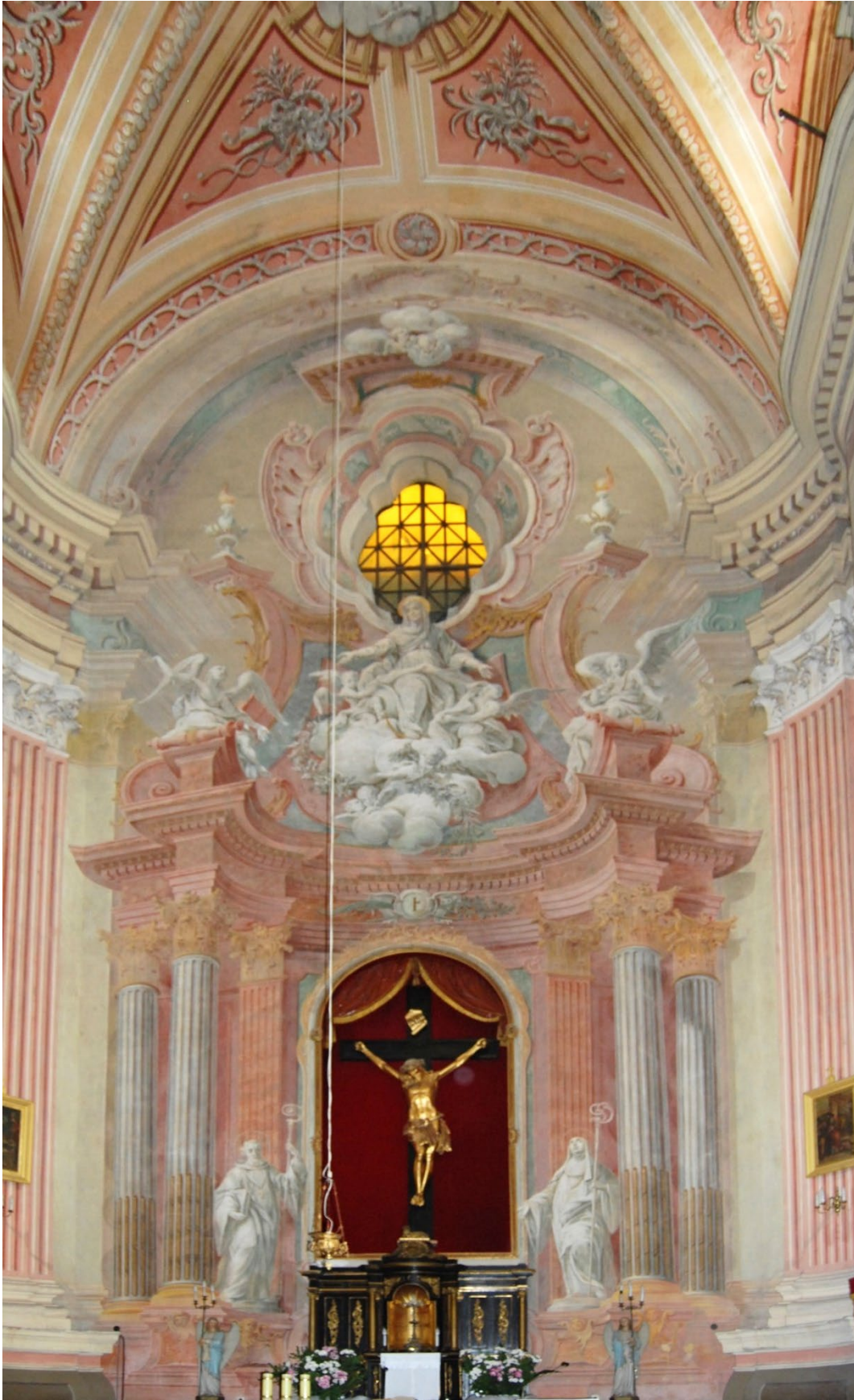
Sieciechów-Opactwo, kościół opacki benedyktynów (ob. parafialny) pw. Wniebowzięcia Najsw. Marii Panny i Dziesięciu Tysięcy Męczenników, iluzjonistyczna struktura ołtarza głównego, po 1769, wyk. nieustalony warsztat z Warszawy (?), fot. MW, 2016