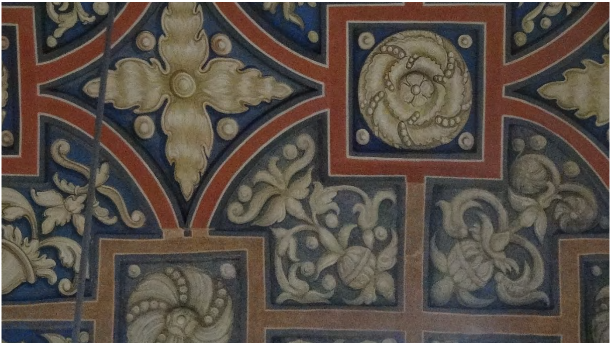
Brochów, kościół par., prezbiterium, sklepienie, fragment oryginalnej polichromii, po 1561, proj. Giovanni Battista Venetus z Płocka (atryb.), wyk. niustalona pracownia malarska z Warszawy lub Płocka (atryb.), 2016.